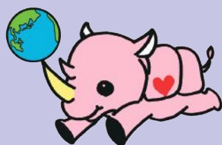
さいがた医療センターキャラクター さいがタン

独立行政法人国立病院機構 さいがた医療センター 〒949-3193 新潟県上越市大潟区犀潟468-1 TEL:025-534-3131 FAX:025-534-4824 http://www.saigata-nh.go.jp/